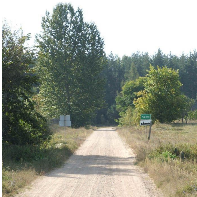
zdj. Droga powiatowa przy granicy Państwa RP z Republiką Białoruś

W latach 1975-1998 miejscowość administracyjnie należała do województwa białostockiego.