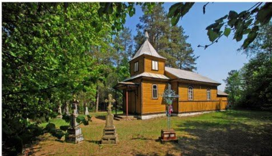
zdj. Cerkiew cmentarna p.w. Narodzenia Przenajświętszej Bogurodzicy

Cerkiew usytuowana jest poza wsią na niewielkim wzniesieniu, w kierunku południowo wschodnim. Stanowi pojedynczą zabudowę z dala od innych zabudowań wiejskich. Cerkiew wraz z cmentarzem jest ogrodzona. Dojazd do cerkwi jest z drogi powiatowej nr 1652B drogą polną. Przy zjeździe z drogi powiatowej stoją ogrodzone dwa krzyże .