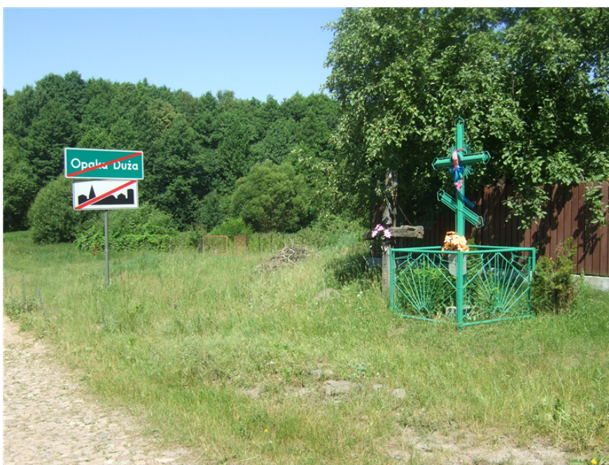
zdj. droga powiatowa (przydrożne krzyże)

Cerkiew usytuowana jest poza wsią na niewielkim wzniesieniu, w kierunku południowo wschodnim. Stanowi pojedynczą zabudowę z dala od innych zabudowań wiejskich. Cerkiew wraz z cmentarzem jest ogrodzona. Dojazd do cerkwi jest z drogi powiatowej nr 1652B drogą polną. Przy zjeździe z drogi powiatowej stoją ogrodzone dwa krzyże .