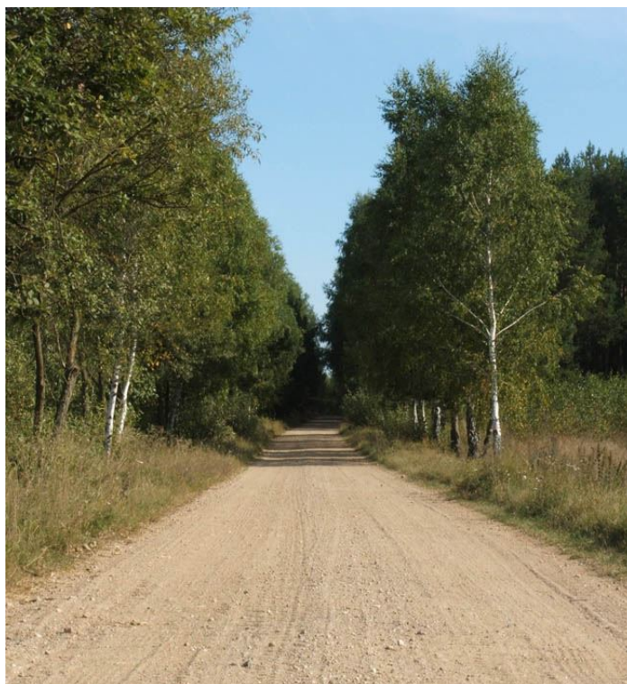
zdj. Droga powiatowa przez las

Obszar Gminy Czeremcha ma charakter leśno-rolniczy. Lesistość gminy jest bardzo wysoka i wynosi 41,2%. Około 30% to lasy państwowe, lasy prywatne stanowią 11%. Lasy Gminy Czeremcha znajdują się w obrębie IV Krainy Mazowiecko – Podlaskiej, 5 dzielnic Niziny Podlaskiej i Wysoczyzny Siedleckiej wg podziału Polski na krainy przyrodniczo leśne. W podziale administracyjnym lasów województwa należą one do Nadleśnictwa Bielsk. W układzie typów siedliskowych lasów- dominuje bór świeży i bór mieszany świeży . Są to siedliska optymalne dla drzewostanów sosnowych i takie też najliczniej występują. Mniejsze znaczenie odgrywa brzoza, świerk, olsza, dąb. Dominującą klasą drzewostanu jest II klasa wieku (21-40 lat) i I (1-20 lat). Duży procent powierzchni gminy zajmują lasy stanowiące genetyczną całość z Puszcą Białowieską w tym regionie jednakże znacznie wytrzebione. Bardziej zwarte kompleksy leśne występują w kierunku północnym od wsi Zubacze. Zalesienia gruntów marginalnych określają opracowane przez Wojewódzkie Biuro Geodezji i Terenów Rolnych w Białymstoku granice polno leśne.