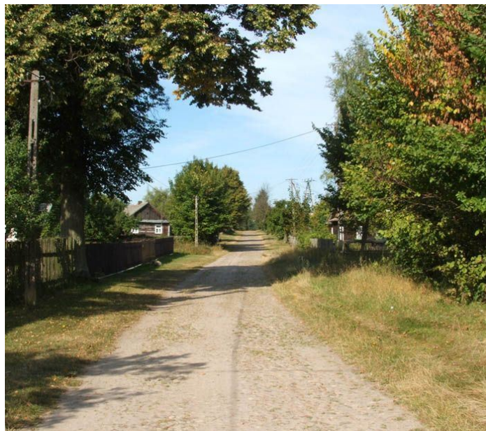
zdj. Miejscowość Opaka Duża